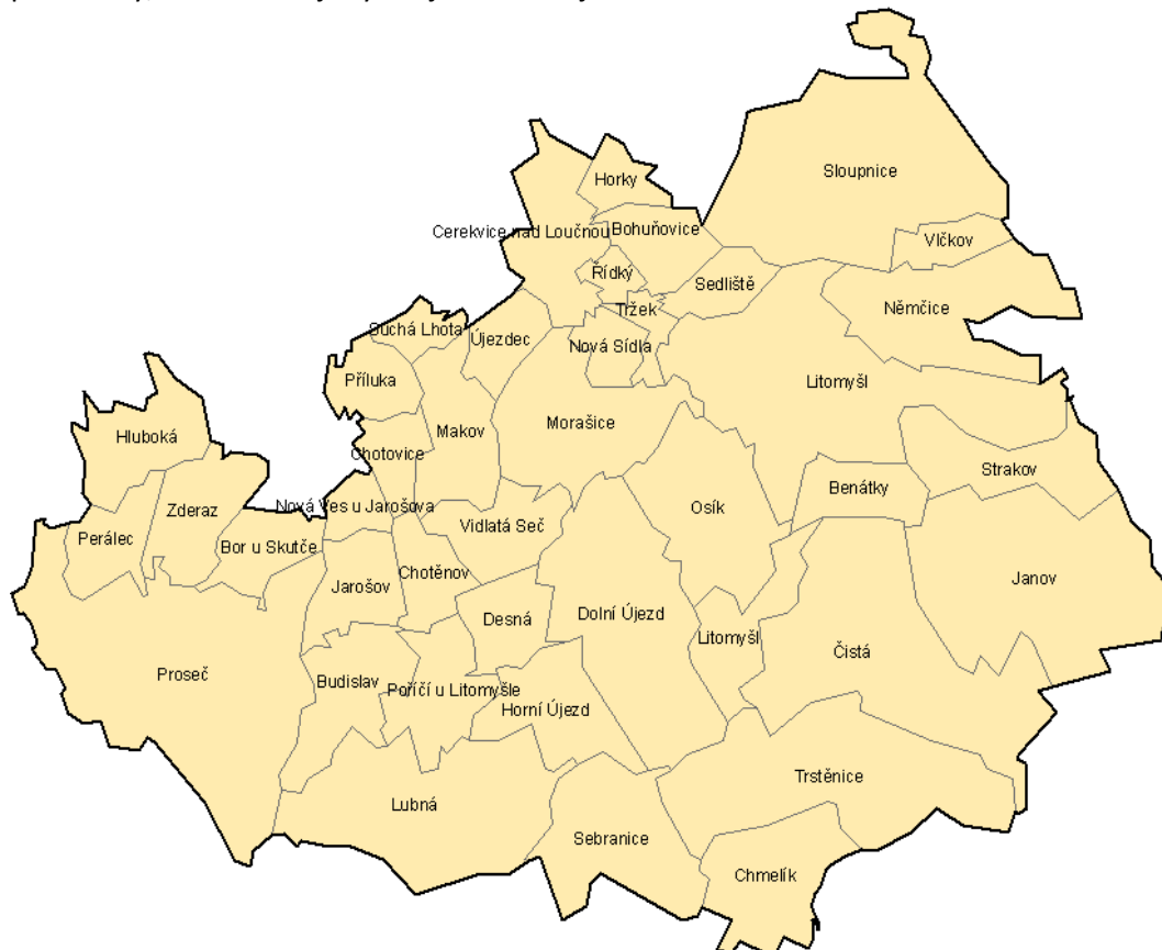
Mapa – území působnosti MAS Litomyšlsko

Území MAS Litomyšlsko sdružuje převážně obce do 500 obyvatel. Pouze malou část tvoří obce s 500 – 1000 obyvateli a obce nad 1000 obyvatel. Dále do území MAS patří jedno město. Společnou charakteristikou tohoto území je převažující část obcí do 500 obyvatel, které se potýkají se shodnými či podobnými problémy jako je nedostatečná dopravní obslužnost, vzdálenost větších měst, nedostatek zejména kvalitních pracovních příležitostí, což způsobuje odchod mladých lidí za prací do měst, je zde málo kulturních, sportovních zařízení a služeb nejen pro obyvatele tohoto území, ale i pro turisty, což zabraňuje rychlejšímu rozvoji cestovního ruchu.